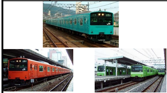
JR西日本商品化許諾済

JR201系は、国鉄初のチョッパ制御・回生ブレーキ装備の省エネ車両として1979年に登場した通勤形電車で、JR西日本管内では京阪神地区で運用されていました。2003年からこれらの在籍車は延命を目的とした大規模な更新が施され、体質改善車と呼ばれるグループが登場しました。大阪環状線や京阪神緩行線で活躍していましたが、新型車両投入に伴い転属が行われ現在は大和路線やおおさか東線で活躍しています。