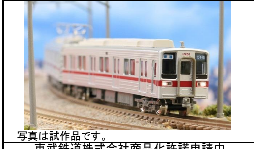
写真は試作品です。